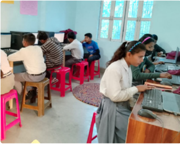
We gaven 1000 euro voor drie nieuwe computers